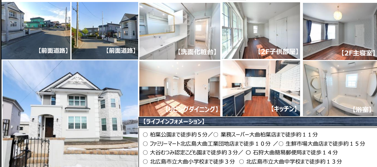
【ライフインフォメーション】